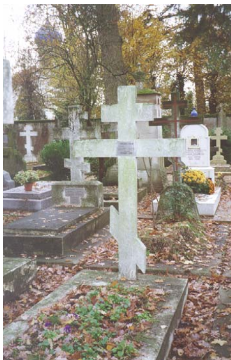
Крест и могила С.М. Прокудина-Горского на кладбище в Сен-Женевьев-де-Буа. Cross and headstone of S. M. Prokudin-Gorsky in the cemetery at Sainte-Geneviève-des-Bois