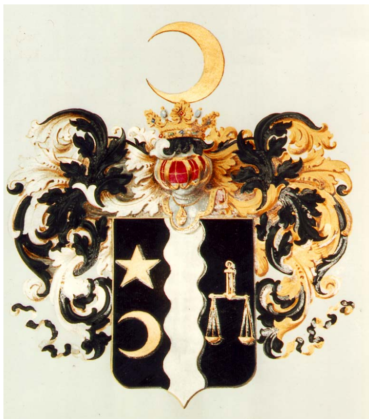
Герб рода Прокудиных-Горских. Живописный оригинал хранится в фонде Департамента Герольдии РГИА СПб. –Ф.1343.-Оп.27.- Ед.хр.6815.-Л.6.

entered in part four of the Genealogy of the Nobility of the Vladimir Government in 1792, and then in 1848 it was transferred to part six. 2