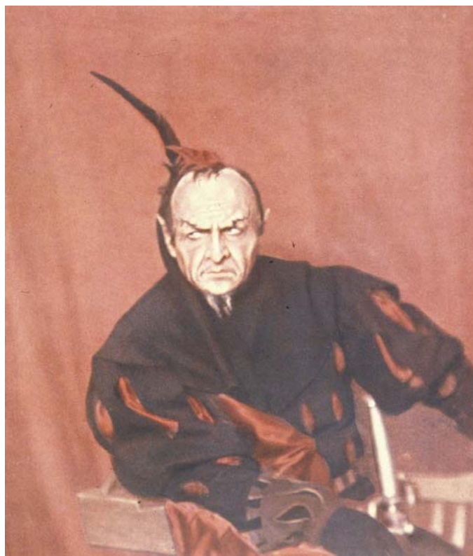
Ф.И.Шаляпин в роли Мефистофеля. («Фауст» Гуно). 1915 г. С натуры.

Somewhat later he took two theatrical photographic portraits of F. I. Chaliapin in the role of Boris Godunov from the opera of that name by Mussorgsky and in the role of Mephistopheles from Gounod’s opera Faust . His portrait as Mephistopheles is little known and there has not been a quality reproduction since 1915. 13