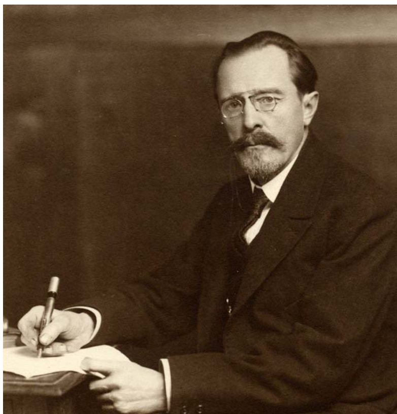
С.М.Прокудин-Горский. Студийный портрет. Лондон. 1910-е или 1920-е годы. Из семейного архива.

Professor, Department of Book Sciences, Moscow State University of Culture and the Arts