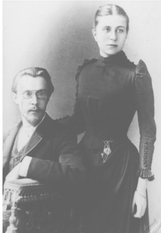
С.М.Прокудин-Горский с женой Анной Александровной, урожденной Лавровой. 1890-е годы (?). Санкт-Петербург. Из семейного архива.