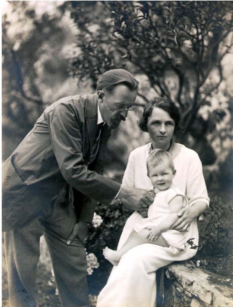
С.М.Прокудин-Горский со второй женой Марией Федоровной (урожденной Щедриной) и дочерью Еленой. 1921 г. Ницца. Семейный архив Сусалиных.

Photographs from the Collection of the Splendors of Russia were shown in Russia for the last time on March 12 and 19, 1918, in the Nicholas Hall of the Winter Palace at evening gatherings called “The Wonders of Photography” organized by the People’s Commissariat for Education. 29